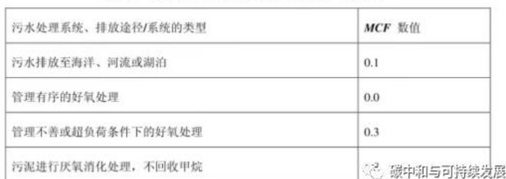
表 1. 甲烷修正因子的 IPCC 默认值 6 （MCF）