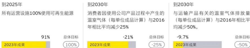
图5：该集团降碳目标进展

2023年，该集团每单位售出产品温室气体排放量（范围1、2和3）较2021年下降约3.3%，全产业链降碳工作取得阶段性成果，各环节量化目标进展如下图所示。