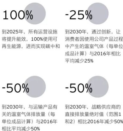
图2：该集团降碳目标 资料来源：公开信息，安永整理